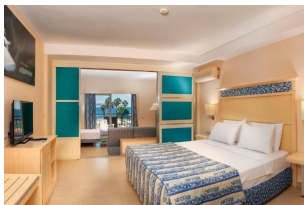
Turquie, Kusadasi HÔTEL EPHESIA HOLIDAY BEACH CLUB

●●●●●○ ⓘ Kusadasi, à 7 km du centre et à 5 minutes à pied de la plage de sable.