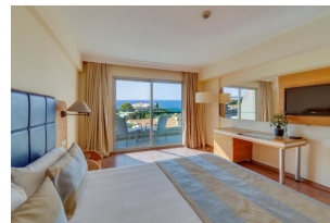
Turquie, Kusadasi HÔTEL MARINA & SUITES

●●●●●○ ⓘ Kusadasi, à 3,5 km du centre historique.