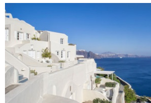
Grèce, Santorin HÔTEL CANAVES OIA SUITES

Santorin, près du village de Perissa et directement sur la plage de sable noir.