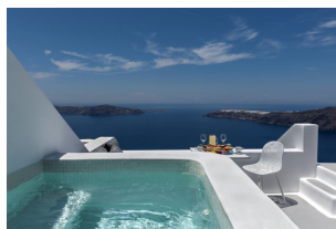
Grèce, Santorin HÔTEL KASIMATIS SUITES

Santorin, à Firostefani et à 15 minutes à pied de Fira.