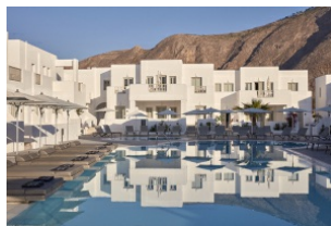
Grèce, Santorin HÔTEL AQUABLUE

Santorin, à Imerovigli, à 15 minutes à pied du centre-ville de Fira et à 700 m de Firostefani.