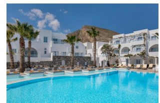
Grèce, Santorin HÔTEL SANTORINI KASTELLI RESORT

Santorin, au cœur du centre animé de Kamari et à quelques pas de la plage de sable noir.