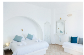
Grèce, Santorin HÔTEL ILIOPERATO

Santorin, dans le très joli village de Oia à 15 km de la petite capitale de Fira.