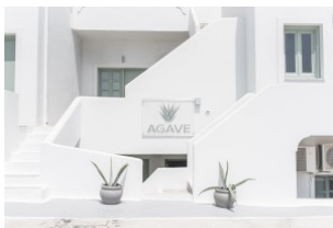
Grèce, Santorin HÔTEL AGAVE